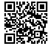
土浦駐屯地ホームページ

陸上自衛隊の後方支援に係る教育及び研究体制を強化するため、武器学校、需品学校、輸送学校を統合し「陸上自衛隊後方支援学校」を朝霞駐屯地に新設しました。この際、武器学校は後方支援学校の下部組織として編成され「後方支援学校 武器科部」と名称変更しました。後方支援学校武器科部は、陸上自衛隊の装備する戦車、装甲車などの車両、小銃、機関銃、火砲などの火器、誘導武器、弾薬などの補給・整備教育及び不発弾処理・鍛造溶接などの技術教育並びに幹部自衛官の運用教育を引き続き実施していきます。