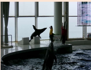
2年生遠足 イルカとアシカのショー

これ以外にも毎日の授業を通して、子供たちは大きく成長しています。もうすぐ訪れる夏休みに向け、なお一層成長できるように支援して参ります。保護者の皆様には今後ご支援とご協力をお願いいたします。