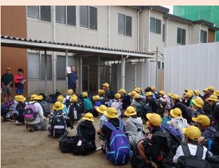
6年生修学旅行 出発式