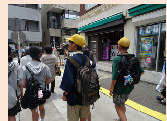
6年生修学旅行 買い物&食べ歩き