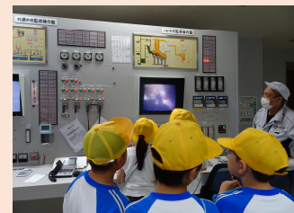
4年生 霞クリーンセンター いろいろな機械がありました