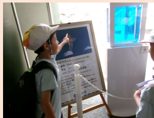
2年生遠足 見て！クリオネがいるよ