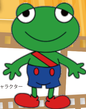
県交通安全キャラクター ストップくん