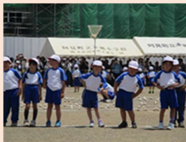
1年生はかわいらしくがんばりました