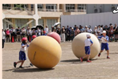
3年生大玉転がし、まっすぐ進むかな