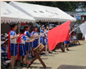
応援団が力強く盛り上げました

本郷小学校の子供たちは、ご覧いただいた通り、何事にも一生懸命頑張る子どもたちです。この子どもたちが、より一層成長するために、これからもいろいろな場面でご支援とご協力をお願いいたします。