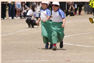
2年生のデカパン競走、走りにくいよ～