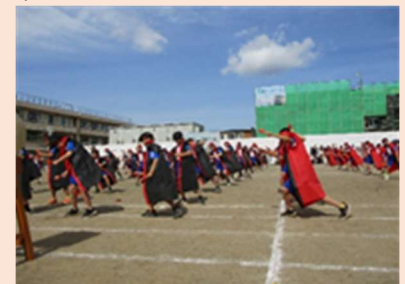
最後のトリは、5・6年生本郷よさこい