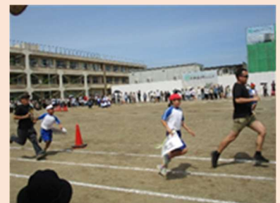
5年生の借り人競走、先生、速い!