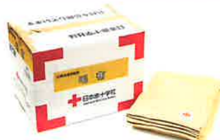
被災者配布用毛布 1人分