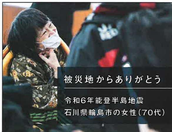
被災地からありがとう 令和6年能登半島地震 石川県輪島市の女性(70代)

日本赤十字社(本社)と連携して、バングラデシュの避難民を支援するため、慢性疾患への対応、母子保健、疾病予防等の活動を実施します。皆さまのご支援は、県内にとどまらず、全国、世界に届きます。