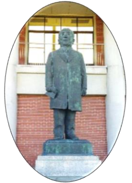
渋沢栄一記念館にて