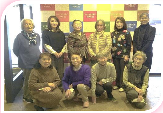
国立女性教育会館にて

1月23日に、男女共同参画社会を推進するリーダーとしての資質向上と広い視野を養うことを目的に開催されている女性活躍推進研修会に参加しました。