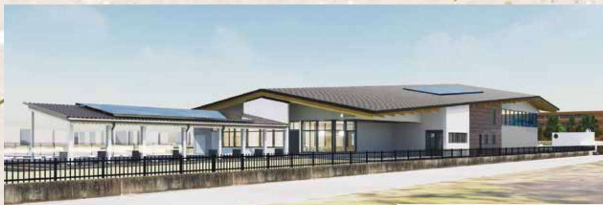
あみ子育て支援センター 外観イメージ

本年 4 月には、子育て世帯の交流・相談の場となる施設として「あみ子育て支援センター」が開設されます。また、子育て世帯の増加に伴う保育需要の高まりに対応するため、新たに二つの民間保育園が開園し、一つの幼稚園が認定こども園へ移行する予定です。今後も、皆様が安心して子育てできる環境づくりを推進してまいります。