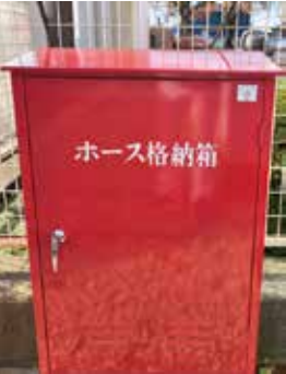
整備されたホース格納箱

二区南自主防災会において、(一財)自治総合センターが実施する「令和7年度コミュニティ助成事業」を活用して、地域の防災活動に必要な消火栓ホース格納箱を整備しました。この助成制度は、(一財)自治総合センターが、宝くじの普及広報事業費として受け入れる受託事業収入を財源として、自治会や町内会などのコミュニティ組織が実施するコミュニティ活動に対し助成をする制度です。今回の消火栓ホース格納箱の整備により、地域の防災活動が一層活発化されることが期待されます。