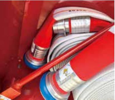
消火栓ホースおよびマンホールキーハンドルを格納しています