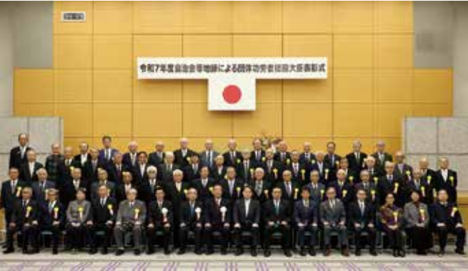
令和7年度自治会等地縁による団体功労者総務大臣表彰式(最前列一番右)