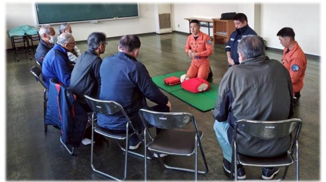
【写真下】心肺蘇生法を確認する様子