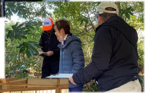
【写真右】 防災まち歩きの様子