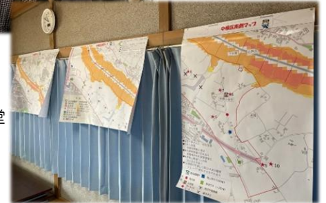
【写真右】 防災マップを公会堂 に掲示する様子