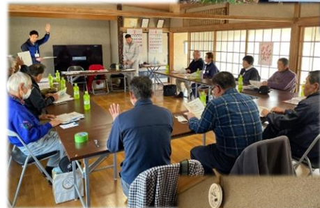
【写真左】 地区防災計画(案) を確認する様子