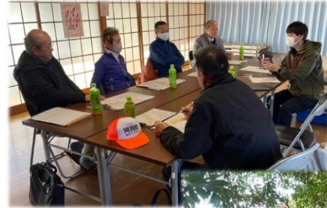
【写真左】 防災まち歩き前の 打ち合わせの様子

令和8年3月21日(土)、中根区公会堂において開催された役員会で、防災まち歩きの結果を反映した防災マップ及び地区防災計画(案)を確認するとともに、地域の危険箇所などについて説明を行い、地区防災計画(案)の内容について協議しました。その後、役員間で共通理解を図りながら地域の実情を踏まえた地区防災計画を策定し、その内容をまとめた地区防災計画及び防災マップを中根地区内の全世帯へ配布し、地区内での情報共有を図りました。