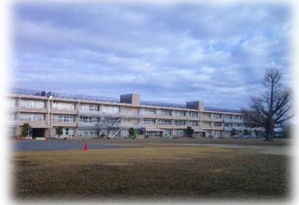
【新年の学校の風景】

冬休み中には、石川能登半島の地震が起こり、日本中が悲しみに包まれました。連日、ニュースや新聞でも報道がなされており、本県でも支援の輪が広がっています。阿見小学校でも、子ども達を中心に自分たちでできることを考え、行動に移していこうと企画しています。また、いざというときの備えを見直す機会でもあります。ご家庭でも、折に触れ話題にさせていただけると幸いです。