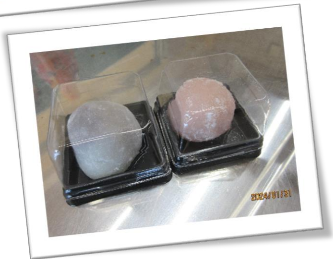
創立 40 周年記念をお祝いしてくださる「紅白大福」をありがとうございました 😊