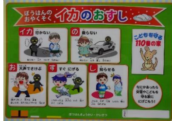
【イカのおすし下敷き】

1年生全員が、防犯教室での話を真剣に聞き、防犯に対する意識を高めることができました。