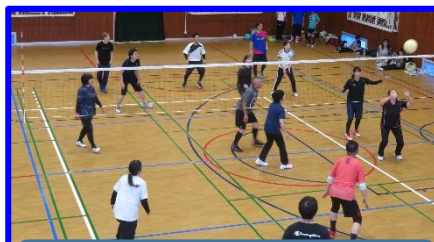
岡崎 vs 霞台