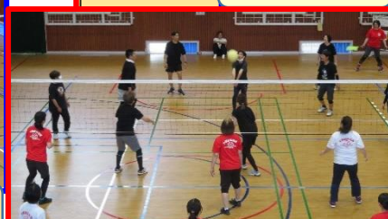
中郷東 vs 曙南