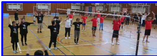
ラジオ体操～参加者全員