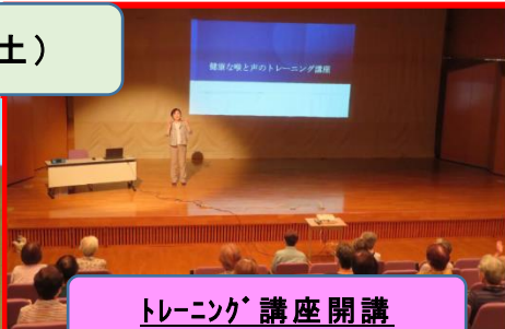
トレーニング講座開講