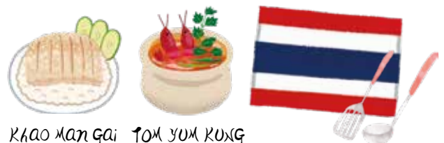
Khao Man Gai TOM YUM KUNG

町阿見町国際交流協会事務局 ※月曜日～金曜日の午前9時～午後4時（祝日を除く） ☎029-888-1111(292)