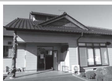
●公会堂を整備しました（追原）