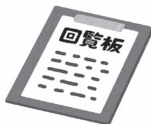
●大事なお知らせを回覧板でまわしています