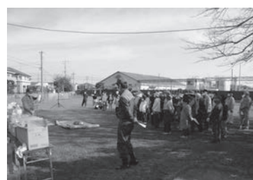
●地域一体となって防災訓練をしています