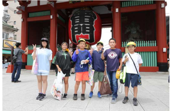
～浅草・雷門にて～

午後は、浅草寺でお参りをしたり、仲見世で買い物をしたりと、子どもたちは東京での楽しい時間を過ごすことができました。見学中の態度、友達との交流、すべてにおいて最高学年らしい遠足で、担任はもちろん、引率した教員がみな有意義な時間を共有することができました。