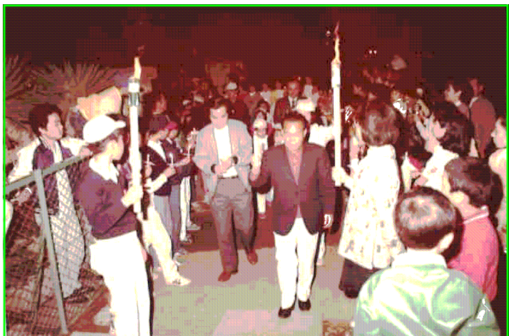
お別れ集会「ローソクの火の光で送られる児童と職員」