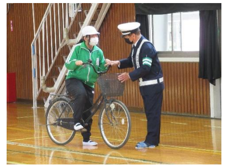
【自転車の乗り方を教わっているところ】

自転車点検の合言葉 「ブタはしゃべる」 「ブ」…ブレーキ 「タ」…タイヤ 「は」…ハンドル 「しゃ」…車体 「べる」…ベル