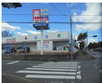
【ウエルシア岡崎店前】