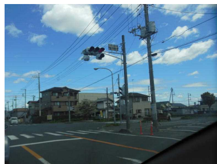
【水戸信用金庫阿見支店前 (霞台交差点付近)】