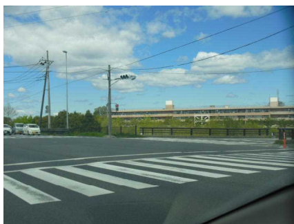
【東京医大東交差点】