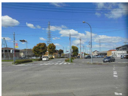
【セブンイレブン 阿見あけぼの店前】