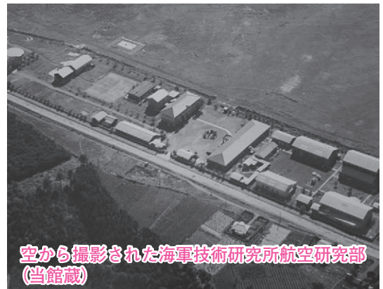
空から撮影された海軍技術研究所航空研究部

明治の末期には外国機を輸入して模倣することで精いっぱいだった日本が、太平洋戦争終戦までの約40年で世界に並ぶ航空技術大国に成長したことは驚異的であり、先人たちの努力に頭が下がります。終戦後、GHQにより航空機の製造は禁止されてしまいましたが、培われた技術は新幹線や自動車などの分野で大きく花開きました。現代を生きる私たちの生活もこうした歴史に支えられていることを思うと、改めて感謝の念がわいてくるとともに、もっと歴史を知りたいという気持ちになります。