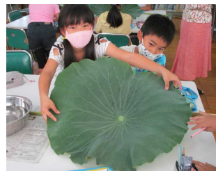
<4年生>食に関する学習「おやつアドバイザーになろう」