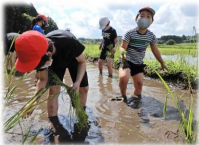
5年生：春恒例の田植え