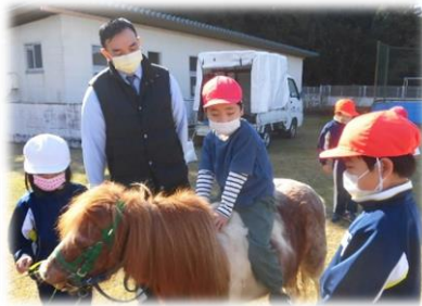
1・2年生：ポニーとの触れ合い