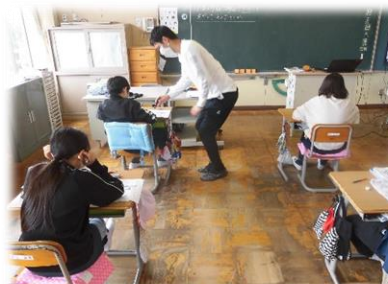
一人一人にきめ細かな学習指導