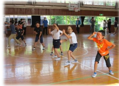
3～6年生：ひよっこの練習