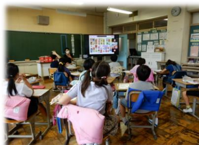
デジタル黒板でオンライン工場見学