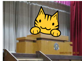
チーム4を代表して3学期の抱負を発表しました。

5年生の家庭科では、裁縫用具を使います。学校で注文したい場合は、ご利用ください。授業参観の日に、一部見本を置きますのでご覧下さい。なお、運針練習布を4学年の教材費で購入させていただきます、5年生に持ち上げます。