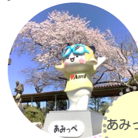
あみっぺ像(令和5年度設置)