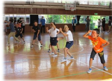
3～6年生：ひよっこの練習