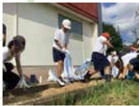
枯竹チップを散布する児童たち

令和7年夏から君原小学校児童たちもこの活動に参加し、竹林の散策や伐採した枯竹から製造したチップを花壇や庭園に散布し、被覆材（※雑草を抑制するもの）としての効果について実験するなどの活動を行いました。