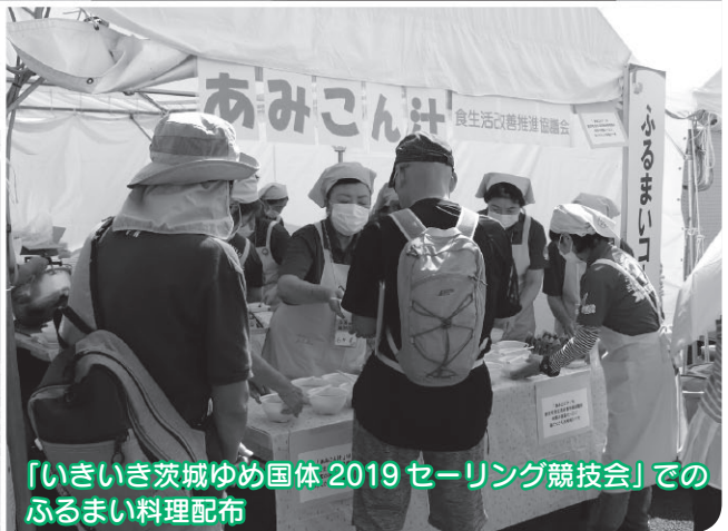
『いきいき茨城ゆめ国体 2019 サーリング競技会』でのふるまい料理配布