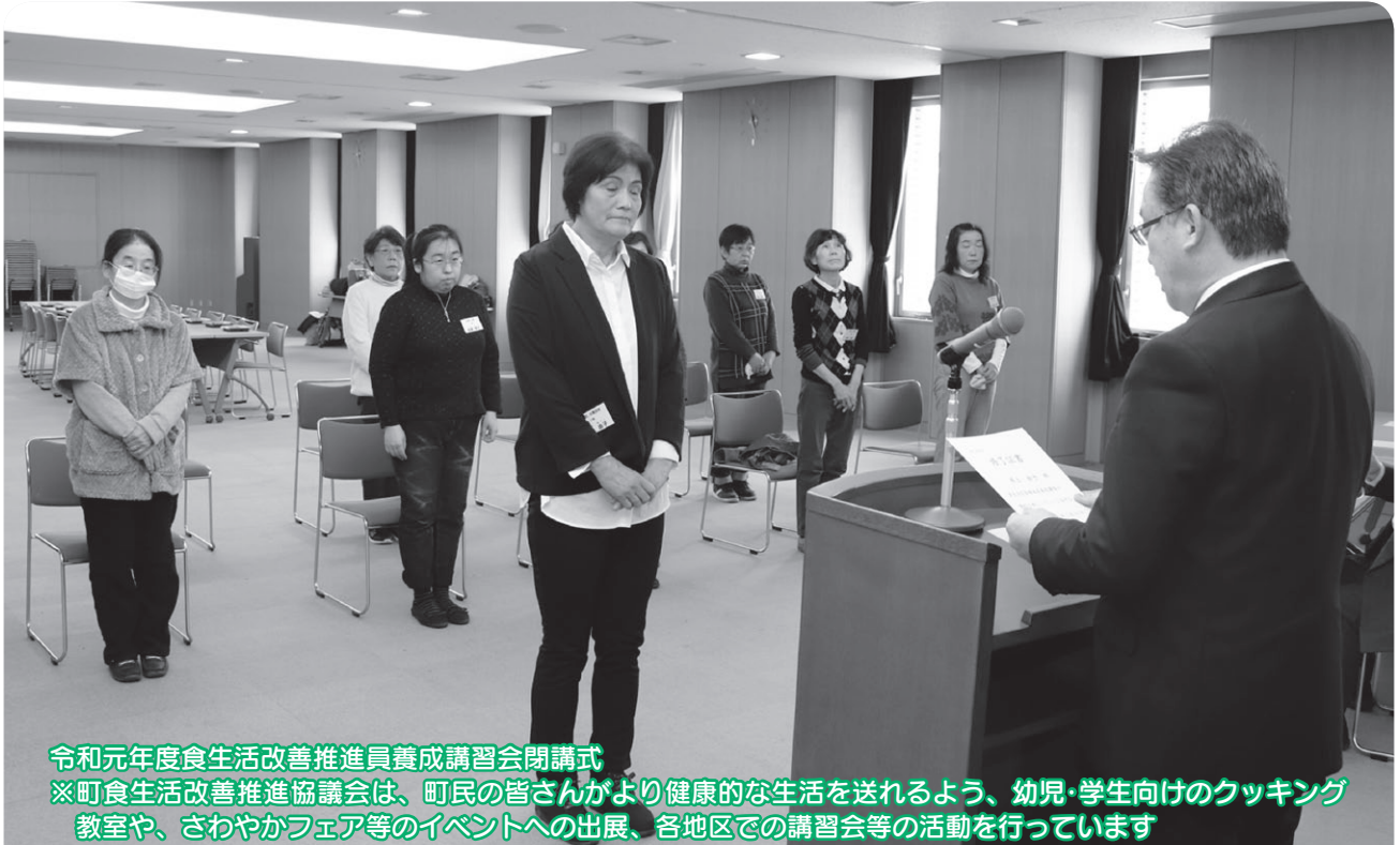
令和元年度食生活改善推進員養成講習会閉講式

※町食生活改善推進協議会は、町民の皆さんがより健康な生活を送れるよう、幼児・学生向けのクッキング教室や、さわやかフェア等のイベントへの出展、各地区での講習会等の活動を行っています