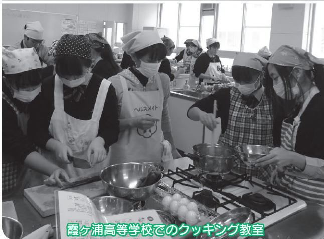
霞ヶ浦高等学校でのクッキング教室

※町食生活改善推進協議会は、町民の皆さんがより健康な生活を送れるよう、幼児・学生向けのクッキング教室や、さわやかフェア等のイベントへの出展、各地区での講習会等の活動を行っています