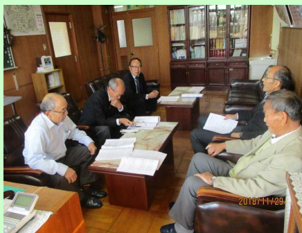
【第2回 学校評議員会】