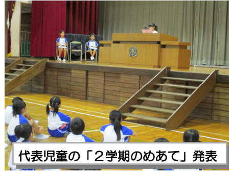
代表児童の「2学期のめあて」発表

2学期スタート！ 作品や水筒を抱え、汗をかきながら登校してくる子どもたち一人一人の顔がとても成長したな感じています。いろいろなことを体験し、充実した夏休みを送ることが