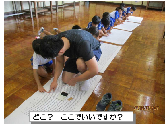
どこ? ここでいいですか?