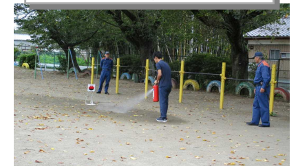
消火器による消火訓練