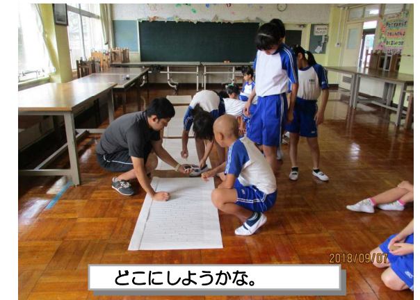
どこにしようかな。

9月7日(金)図工室において、【運動会場所取り入場券】の児童による【くじ引き】を行いました。朝の時間・中間休み・昼休みを使って、児童一人一人が選んだくじを、担任は一人一人確認しながら、間違えのないように名前ゴム印を押していきました。「どこにしようかな?」となかなか決まらない児童もいましたが、ほとんどは「先生、ここでいいです!」と決めてくれました。くじ引きをする前に、くじを引く理由や6年生からくじを引く理由など、担任が丁寧に説明してから、始まりましたので、児童も納得しながら、くじ引きに臨むことができました。結果は、今週、「運動会場所取り入場券」と引き換えに、ご家庭にお知らせします。初めての試みで、不手際などがあるかもしれませんが、ご理解・ご協力のほど、よろしくお願いいたします。また、当日、 場所取りに車でお越しの場合には、三角駐車場で荷物をおろし、駐車は保護者用駐車場(第2駐車場)をご利用ください。 詳細は、「9/3付の運動会のお知らせ」をご覧ください。