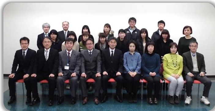
阿見小学校・吉原小学校 統合準備委員

平成30年3月8日(木)に中央公民館多目的室にて、最終の第5回阿見小学校・吉原小学校統合準備委員会を開催しました。「PTA・総務検討グループ」、「通学体制検討グループ」、「教育課程検討グループ」の各グループで検討した内容の最終報告が行われました。様々な協議事項にご尽力頂きまして、誠にありがとうございました。