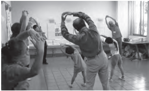
▲オリジナルストレッチ「花体操」

町運動普及推進協議会は、町民の皆さんに、健康を維持するための運動の普及活動を行うボランティア団体です。 今回は、昨年の10月23日に、総合保健福祉会館「さわやかセンター」で開催された『さわやかフェア2016』での活動の様子などを紹介します。 ■さわやかフェア2016 『健康体操コーナー』 町運動普及推進協議会では、日ごろの活動のPRと運動習慣づくり推進のために、4つの運動を町民の皆さんと行いました。 ▼オリジナルストレッチ「花体操」：唱歌『花』に合わせてゆっくり全身をストレッチします。