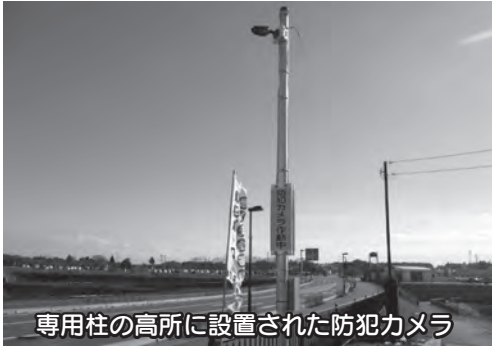
専用柱の高所に設置された防犯カメラ

平成28年12月16日、JRA美浦トレーニングセンターから防犯カメラ4台が寄贈されました。防犯カメラは吉原区画整理地区内のふれあいの杜公園付近に設置され、周辺地区の防犯のために活用させていただきます。ありがとうございます。