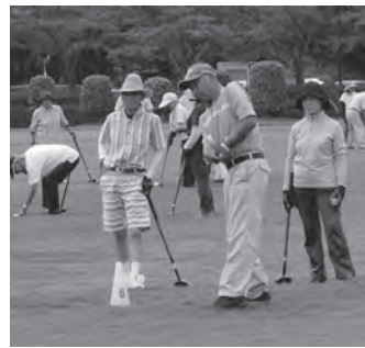
▲グラウンドゴルフ競技会

競技会では毎回100人以上の選手が、日ごろの練習の成果を発揮して元気に競技に励んでいます。