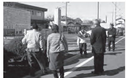
▲▼毎月多くの皆さんをご案内します

これらのコースに加えて、昨年の11月27日には、町観光協会と協力して町の福田地区で行われている子孫繁栄と豊作を祈る奇祭「福田の馬鹿祭り」を町内外の皆さんにご紹介しました。