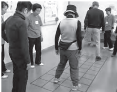
▲スクエアステップ

▼スクエアステップ：床のマス目をお手本通りの順番に踏み進みます。さまざまな難易度のステップがあり、体と頭の運動になります。