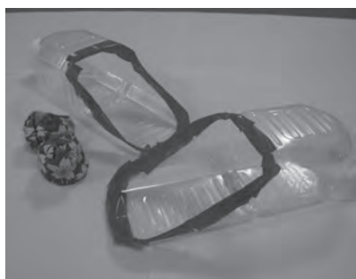
▲ペットボトルラクロスで使う道具

当日は一日を通してたくさんの方の皆さんに会場にいらしていただき、私たちも張り切って活動することができました。 参加された人からは「久しぶりに体を動かして楽しかった」「体がのびて気持ち良かった」などの声をいただき、私たちも励みになりました。 今回のさわやかフェアのように、いろいろな世代の皆さんにふれあうことができる機会を