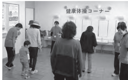
▲ スクエアステップの様子