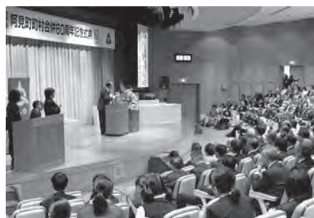
▲町村合併 60 周年記念式典の様子

町村合併 60 周年を記念して、平成 27 年 4 月号通常版から 12 回にわたり連載してきました特別寄稿は今回の掲載をもちまして終了となります。皆さまから貴重な寄稿文をお寄せいただきまして、ご協力いただきました。ありがとうございます。