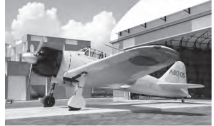
▲実物大で再現された『零戦』