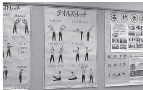
▲ タオル体操の方法

アステップ同様に、思うように手指が動かず悪戦苦闘し『あつ、間違えちゃった!』と笑い声が響きました。