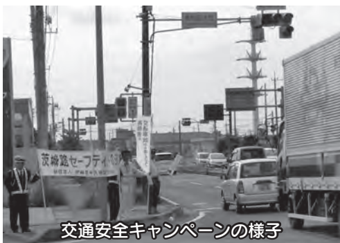
交通安全キャンペーンの様子

平成27年12月2日、県庁(水戸市)において市町村交通死亡事故ゼロ達成表彰式が開催され、町は同年11月20日に交通死亡事故ゼロ300日を達成したことにより表彰されました。今後も、牛久警察署交通安全協会・交通安全母の会等の関連団体と連携して交通安全運動に取り組みでいきます。皆さまのご協力をよろしくお願いいたします。