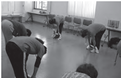
▲ タオル体操の様子

タオルを使うことで、いろいろな動きに対応でき、強度も調整しやすく、体が動かしやすくなります。