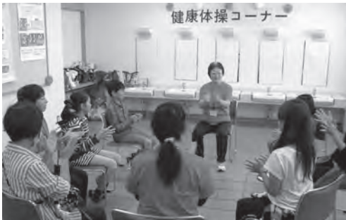
▲ 脳トレ(手遊び・指遊び)の様子

アステップ同様に、思うように手指が動かず悪戦苦闘し『あつ、間違えちゃった!』と笑い声が響きました。