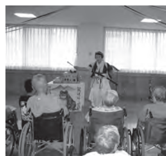
▲介護施設訪問の様子

■ 子どもとのふれあい活動 町シルバークラブ連合会と地域の子ども育成会等が共同で行う事業です。