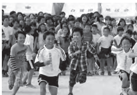
▲町民が主役のまちづくり

平成 8 年～平成 19 年町防犯連絡員協議会会長。平成 20 年～現在まで町防犯連絡員協議会顧問。平成 19 年 10 月 4 日防犯功労栄誉金章受章。平成 21 年 2 月 27 日茨城県町村会から民間自治功労者表彰。平成 21 年 11 月 3 日藍綬褒章受章。