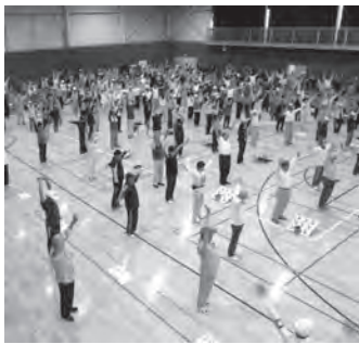
▲準備体操中の参加者

■ ペタンク・クロケット大会 年に1回、県大会に出場する町の代表を決定するため、町福祉センター『まほろば』のクロケット場で大会を開催しています。