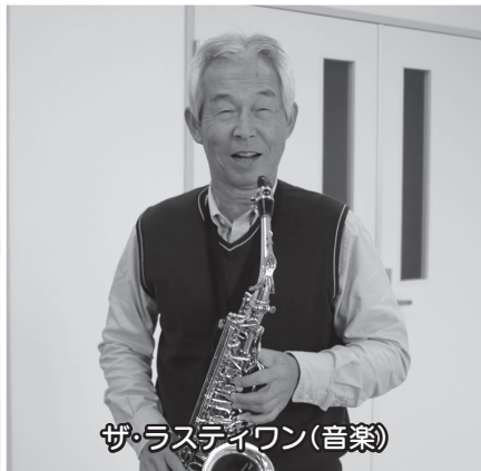
ザ・ラストイワン(音楽)