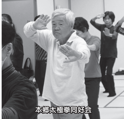
本郷太極拳同好会