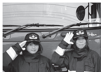
▲平成25年度入団の学生団員