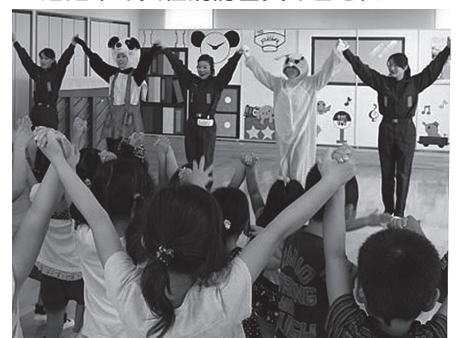
▲保育所での防火防災教室