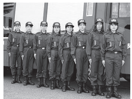
▲活躍中の女性消防団員の皆さん