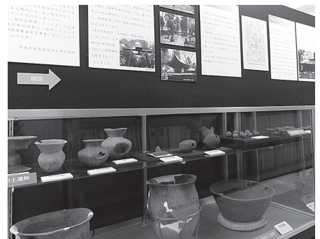
▲文化財ミニ展示室内展示風景