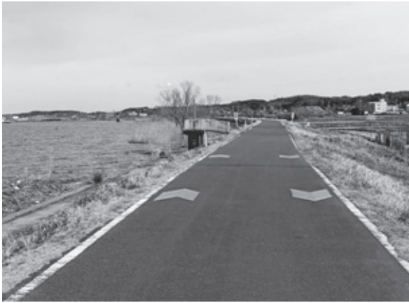
サイクリングロードの矢羽根表示

誘導するため、「おすすめサイクリングコース」等を紹介する「あみサイクリングマップ看板」を本線上の3カ所に設置しております。