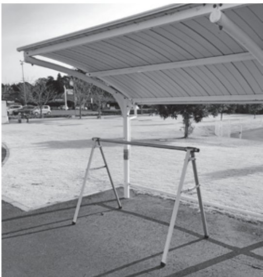
予科練平和記念館に設置されたサイクルラック

また、平成30年度からサイクリングのハイシーズンである春から秋にかけて、荷物を多く持たないサイクリストでも手軽に参加でき、町内を周遊しながらスタンプを集める「スマホスタンプラリー」を