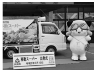
買物支援事業の移動販売車