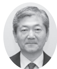
海野 隆 議員

家族の多様性に対応した支援のあり方は、日本の未来を支える子どもたちへの支援となります。阿見町の「ひとり親」世帯の子どもたちの貧困率や所得状況はどのようになっていますか。