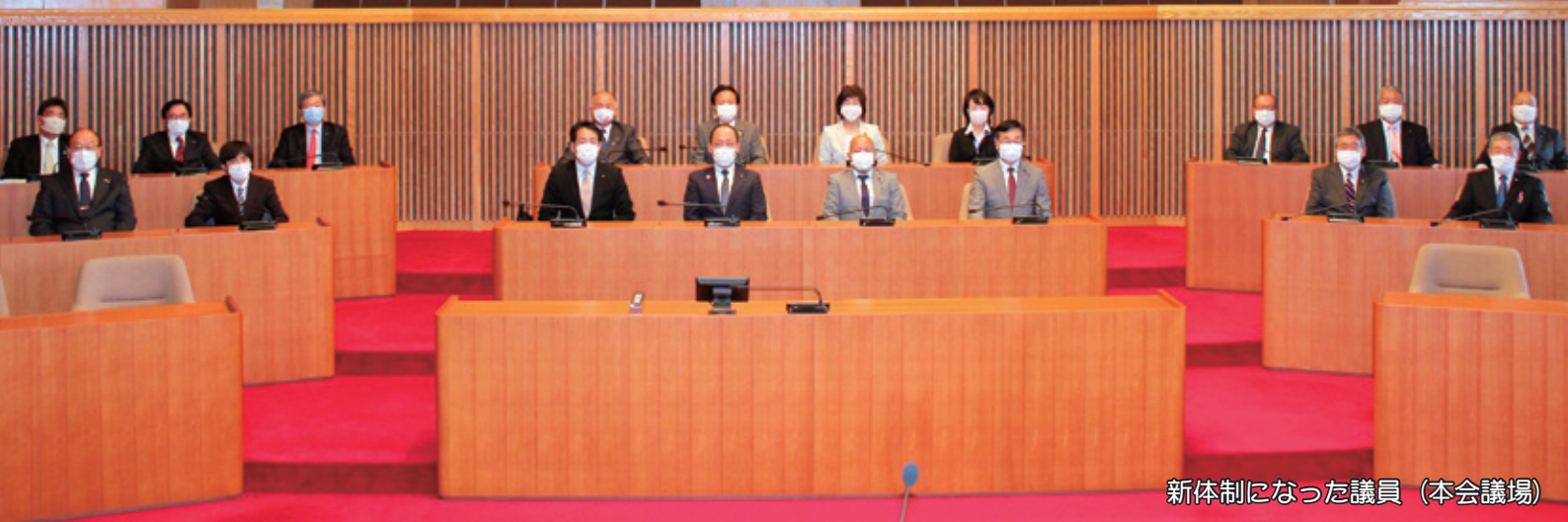
新体制になった議員（本会議場）