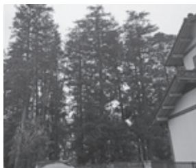
住宅に隣接した高木