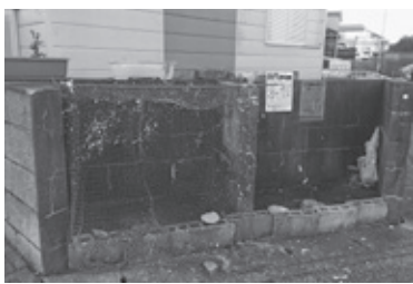
不法投棄されているゴミステーション