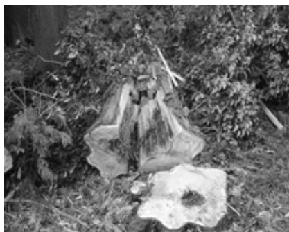
台風により倒れた高木