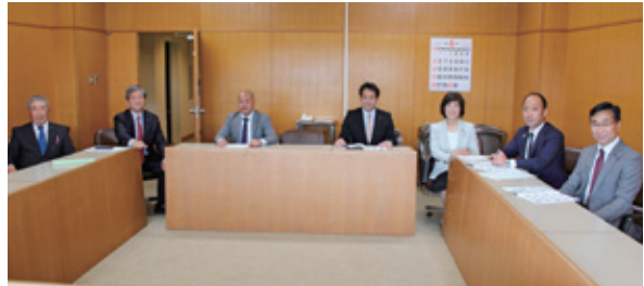
議会だより編集委員会(4月14日)