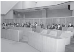
令和2年第1回定例会の様子