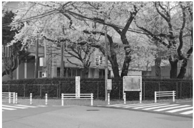
交差点安全対策工事例（中央北）

差点安全対策を12カ所、交差点のカラー舗装を1カ所、通学路へのグリーンベルト設置を1路線行います。そのほかに、未就学児のお散歩コースの安全対策として、路面の表示や歩道の段差解消、側溝のふたの設置など10カ所の対策を行います。また、町内のサイクリングロード延長約6・2キロメートルに矢羽根