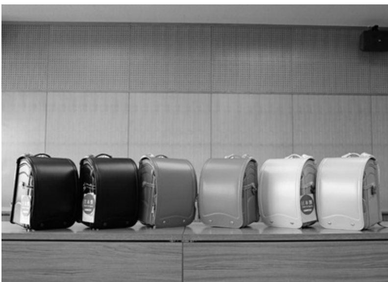
令和2年度入学予定者へ贈呈されたランドセル

答 各メーカーによってデザインはバラバラです。ある程度しつかりした物で安定的に同じような物を贈呈させていただきたいと考えています。評判を聞きながら、まずは3年という目安で考えていきたいと思っています。