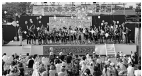
まい・あみ・まつり