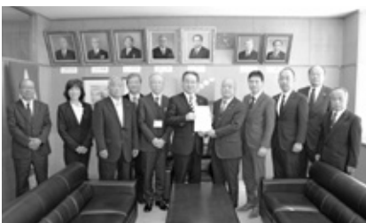
提言書の提出（3月6日）

令和2年第1回阿見町議会定例会最終日において、委員長より調査特別委員会の調査結果が報告され、全会一致で承認されましたので、町長に提言書を提出しました。