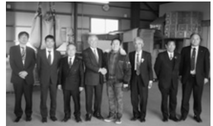
赤城深山ファームにて

赤城深山ファームは、平成25年2月に法人化し、従業員は7名で運営しています。そばの栽培、加工、販売事業を展開する農業生産法人で、平成26年2月に6次産業化推進整備事業を活用して加工用機械を導入するなど、6次産業化に取り組んでいます。栽培したそばは、全国そば優良生産表彰事業において農林