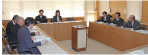
議会だより編集委員会(1月19日)

4日 議会報告運営委員会 (議会報告会の開催の検討等について他) 4日 議会だより編集委員会(155号編集) 19日 全員協議会 (阿見町職員の給与に関する条例等の一部改正について他) 19日 平成30年第1回臨時会 19日 議会だより編集委員会(155号編集)