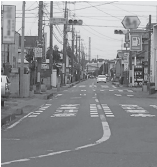
フタムラ化学をのぞむ旧滑走路