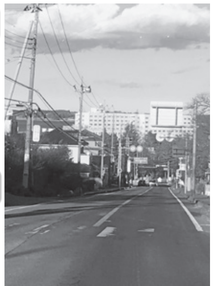
阿見坂上から見た旧海軍道路