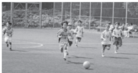
フットサルの試合風景（総合運動公園）

施設により傷み具合も異なることから、各施設の状態を確認し修繕を進めていきます。昨年度に陸上競技場走路改修を行い、今年度内にテニスコート照明灯改修を完成予定です。今後、陸上競技場のスタンド、トイレ、排水の改修、フットサルコートの人芝の張替、野球場照明のLED化を