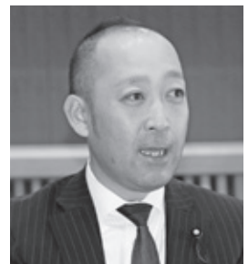
石引 大介 議員