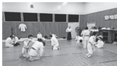
体協曙合気道クラブの練習の様子（竹来中学校）