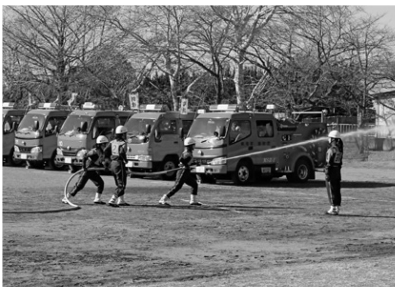
平成30年阿見町消防出初式の様子（1月6日）

問 町税徴収嘱託報酬が180万円減額になっているが、嘱託員は何人いるのか。また、徴収実績はどの程度ですか。