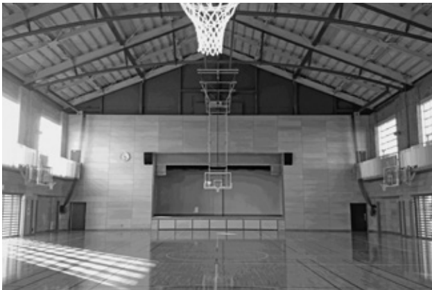
あさひ小学校 体育館

答 今回購入する図書のほか、今現在、実穀小学校にある本をあさひ小学校に持つてくる予定です。実穀小学校にある本が今に合ったものなのか、在庫としてあるかなど、専門的などころを見ていただいで新しく購入する本を選んでいきます。司書の方のお力を借りないといけないような形で進めてきました。