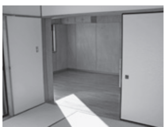
修繕された町営曙アパート

答 町営住宅の管理業務を住宅管理センターに委託することに伴い、各業務に要する経費を代行していただく業務です。その施設の修繕料として、請