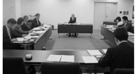
秋田県横手市にて

公共施設等の管理計画について 秋田県横手市を視察 秋田県秋田市で開催された全国 女性消防操法大会を視察