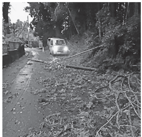
若栗北地区の倒木

10月21日に町域のパトロールを依頼し、22日の台風通過時には、協会等の計画でパトロールを行い、折れた