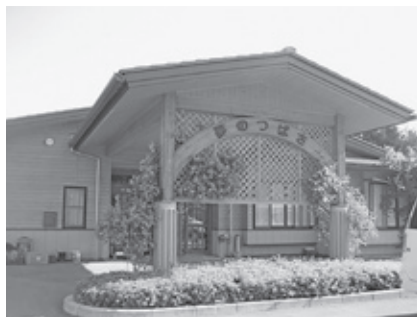
社会福祉法人 夢のつばさ

子どもの将来に関して保護者の方が、公民館を活用し自分たちで障がい者施設「夢のつばさ」の設立運営まで進めました。町においても、身近な学習課題はたくさんあります。例えば、新しい小学校にはプールがない。プールとは何か、子どもたちにとってどう考えるのか。こういうことも十分に学習課題となります。是非、実践的であり発展性のある生涯学習計画を策定していただきたい。