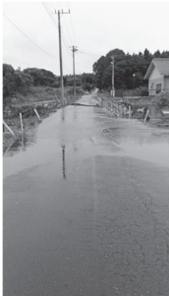
実穀地区の道路冠水

分頃若栗北地区で発生し、倒木を撤去しました。道路冠水は、23日0時頃、実穀地区で道路陥没1箇所、道路冠水1箇所が発生したため、直ちに通行止めにし、牛久警察署に通報するとともに復旧工事を行いました。