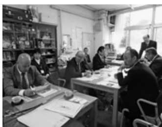
杉並区立三谷小学校にて

この報告はほんの一部ですが、このような取り組みで給食の残菜率は1%以下とのことでした。説明の中で動画の紹介などもあり、非常に充実した視察研修となりました。