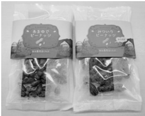
チャレンジ事業を活用して製作した落花生新商品

答 農業者等の組織する団体がブランド化や6次産業化による付加価値向上など、自ら行う強みをつくり、高める革新的な取り組みについて伺います。