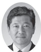
5. 海野 隆 議員 (P10)