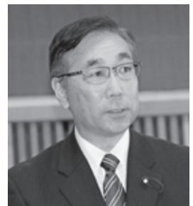
樋口 達哉 議員

町では台風接近に伴う、10月22日14時17分の大雨警報発表と同時に町民生活部長以下交通防災課9名、道路公園課3名の合計13名の職員をもって警戒配備体制を設置・運営しました。