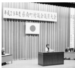
紙井議長による決議報告