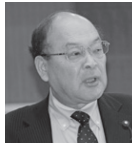
久保谷 充 議員