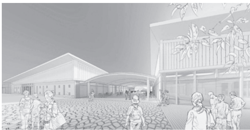
道の駅完成予定図 (パース)