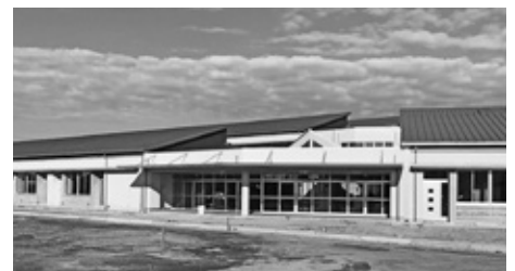
あさひ小学校 校舎