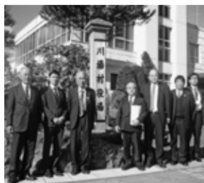
群馬県川場村にて

道の駅川場田園プラザは、農業プラス観光を推進する川場村の産業・情報・交流の核として人気の道の駅であり、ファーマーズマーケットの出荷登録者数が村内農家の約93%に達していることや、お年寄りや専業・パート主婦等の新しい所得と生きがいの場となっていることなど、川場村への地域貢献が高く図られているとのことでした。