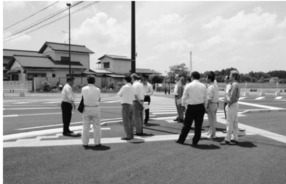
5月15日に開通した都市計画道路 荒川沖・寺子線及び中郷・寺子線

また5月28日には、 予算の執行状況を確認 し、町営住宅の現状と 今後の方向性、4メー トル未満道路の現状、 都市計画道路の現状と 課題について、町内5 箇所の現地を視察しま した。