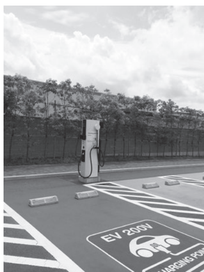
アウトレット内に設置されている充電スタンド