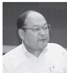
久保谷 充 議員

来年度より事業実施に向けた測量等に着手し、平成31年度から平成35年度の国庫補助事業を活用し、早期に完成させる意気込みを持って取り組む。