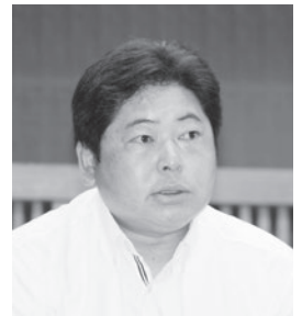
藤平 竜也 議員

現在、町内の宿泊施設は、ビジネスホテルが1軒と旅館が3軒ありますが、ビジネスホテルはほぼ満室状態で、宿泊施設が不足状態であると考えられます。 また、茨城国体のヨット競技開催等で宿泊施設誘致の必要性は更に高まると考えます。