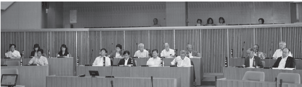
平成26年第2回定例会の様子（6月20日）