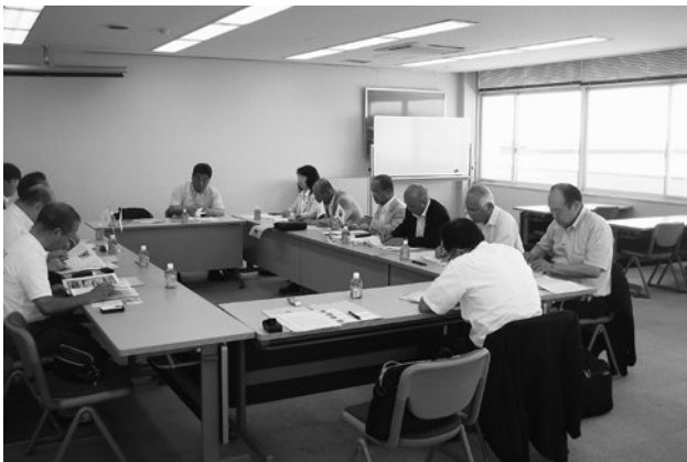
大洗町議会にて（7月8日）

は、ある程度時間をか け、必要性・実行性も 含め調査・研究してい くことを学びました。 大変参考となるもので した。