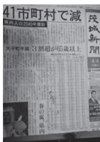
少子高齢化、人口減少は現実です