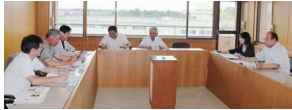
議会だより編集委員会（7月10日）

1日 民生教育常任委員会（予算要望） 8日 議会活性化特別委員会所管事務調査（大洗町、銚田市） 9日 民生教育常任委員会所管事務調査 10日 議会だより編集委員会（141号編集） 11日 産業建設常任委員会（予算要望） 11日 民生教育常任委員会所管事務調査 15日 議会活性化特別委員会（今後の議会基本条例の進め方について） 15日 全員協議会（第1回口頭弁論期日呼出状及び答弁書催告状について） 17日 総務常任委員会（予算要望） 17日 議会運営委員会（平成26年第2回臨時会会期日程） 24日 平成26年第2回臨時会 24日 全員協議会（平成27年度予算要望について）