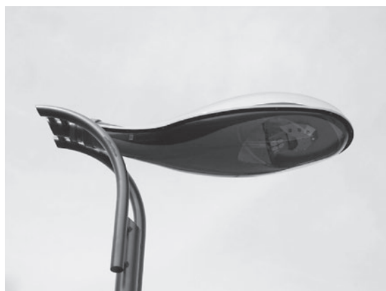
追加工事 840万円で7基設置された給食センター駐車場の外灯 (長さ 133.9cm、幅 50.5cm、高さ 37.6cm)