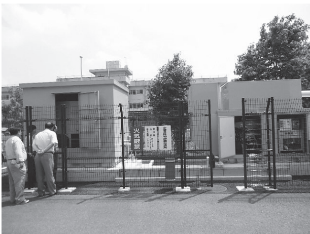
役場庁舎非常用発電機