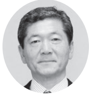
3. 海野 隆 議員(P9) 不適切な最低制限価格の設定によっ て1439万円の貴重な税金が不当 に支出されていないか 他4件