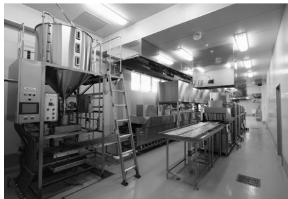
ぱくぱくセンター内部