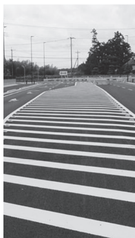
都市計画道路 荒川沖・寺子線

地球温暖化対策のほかにも設備投資などを喚起するという経済対策効果も期待されていることから、町としても維持管理に要する経費や安全性について調査をしたうえで検討していきたい。