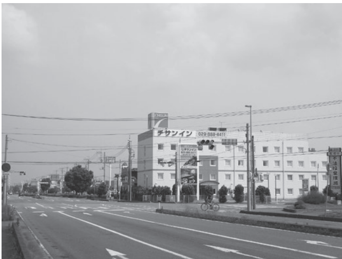
チサンイン土浦阿見

町長 動かないことにはなかなか進めない。町が積極的に進めていきたい。ニーズを把握し、立地に適した土地の確保等についても地権者と話を進めていくことが大事だと思います。