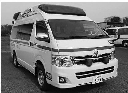
高規格救急自動車