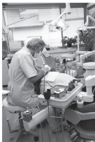
～歯の健康は日頃の手入れから～