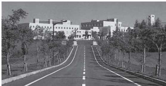
5月16日に連携を結んだ東京農業大学オホーツクキャンパス

④昨年より、福祉・医療・教育・就労の関係機関専門委員をメンバーとし、困難事例が起きた時にボランティアで対応して頂きました。今後は報酬面を考慮したいと思えます。 ⑤相談者の要望は個別事例ごとに多様です。相談者の要望を聞き取り、関係各課等と連携を図り、迅速に対応できる体制を作ります。