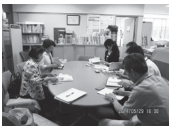
認知症カフェ開設に向けての話し合い