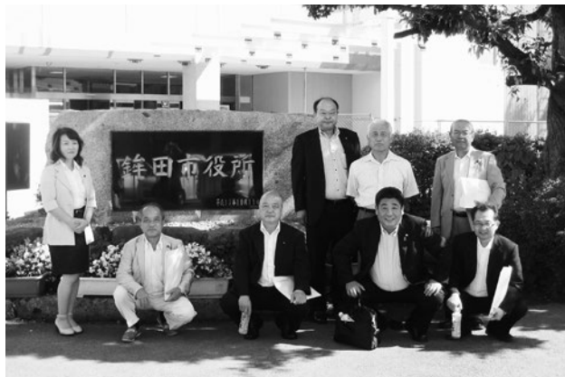
銚田市議会にて（7月8日）