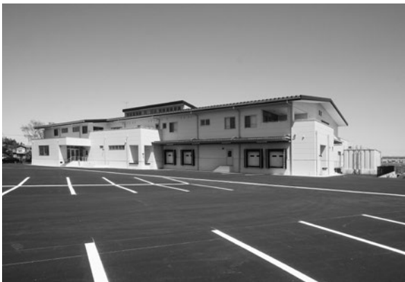
ぱくぱくセンター外観