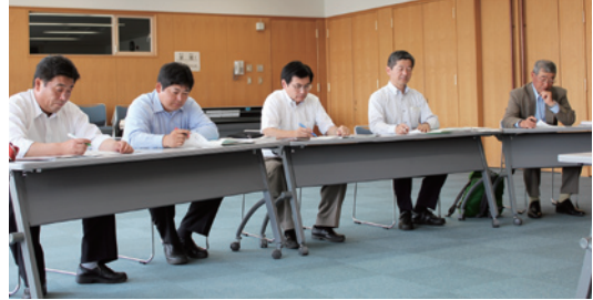
新任議員研修会（5月16日）（さわやかセンターにて）