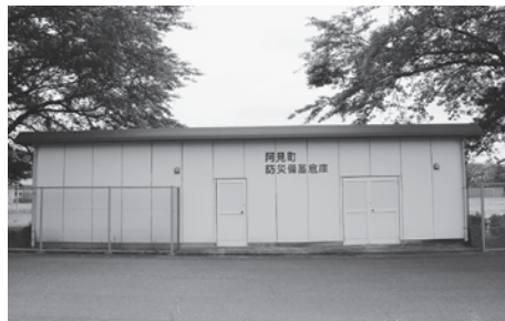
阿見町防災備蓄倉庫 (朝日中学校)

答 阿見町の小学校8校と、阿見中・霞ヶ浦高等学校・中央公民館・かすみ公民館・君原公民館・本郷ふれあいセンター・舟島ふれあいセンター・さわやかセンターです。