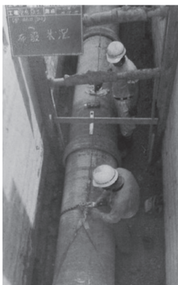
下水管の布設工事の様子

答 小水力発電ということではなくて、循環型エネルギー、太陽光発電、夜間電力を蓄電器に充電して昼間使うというやり方等、専門の業者に委託をしてその中で費用対効果も含めすべて検討し、一番いい方法を考えさせていただきます。