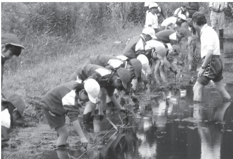
うら谷津（耕作放棄田）での田植風景 （命の大切さを学ぶ場として活用）

農産物特産品等の六次産業化を支援し、引き続き農業と商業の連携と観光振興および地産地消を図るため、今後も継続した取り組みを進める。