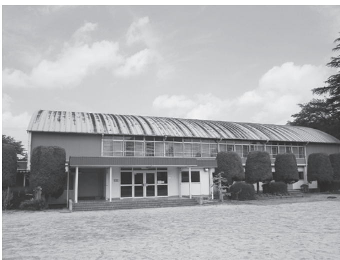
屋根のサビが目立つ実穀小学校体育館

的近距离に位置するという利点を生かし、従来から都市部と農村部の交流が行われている。これらの取り組みについても、今まで同様支援すると共に町としても他市町村との協定が整い次第、阿見の豊かな自然を生かした交流を検討していく。