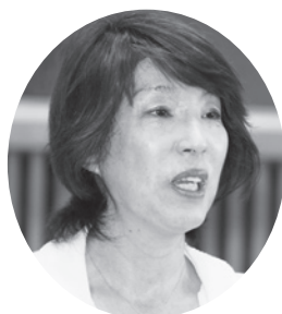
難波 千香子 議員