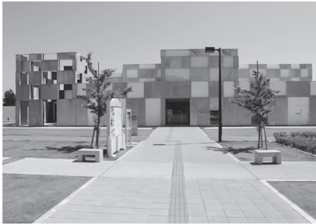
予科練平和記念館

野口 阿見坂下から自衛隊の門の脇を抜ける側道は、予科練平和記念館に行くとき、バスで見学に来た