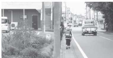
通学路を塞ぐ樹木