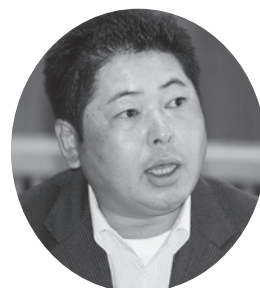
藤平 竜也 議員