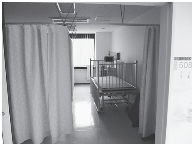
小児科病棟の病室内の様子

この財源確保につき ましては、単純な草刈 り業務も町がやること により、相当金額の財 源を生み出しており、 事業仕分けや入札制度 の見直し等にも積極的 に取り組み、平成25年 度より実施していきたく と考えております。