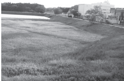
太陽光発電所が設置される香澄の里工業団地の調整池

太陽光発電所を香澄の里工業団地調整池に設置し見学施設の提案を求めています。グリーン