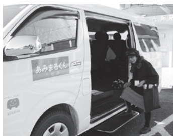
あみまるくん乗車の様子