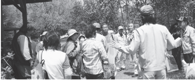
環境保全調査の説明を受けている様子（小池城址公園）

きた、町の動植物、自然環境の実態について把握するフィールド調査を実施して発表や回覧をしており、今後は学校教育、生涯学習に活用します。