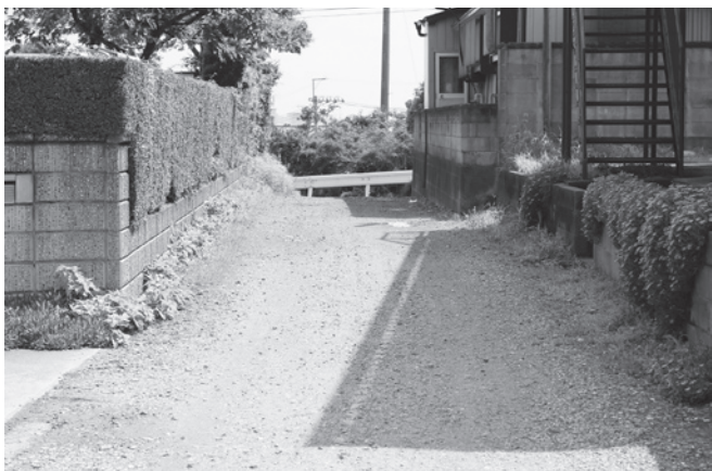
幅員4メートル未満で舗装されていない生活道路（青宿）