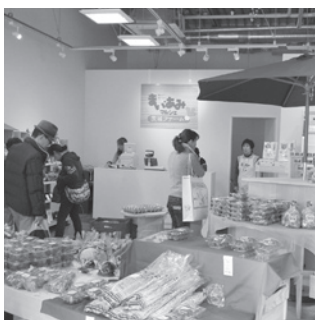
アンテナショップ「まい・あみマルシェ〜茨城ファーム」(あみプレミアムアウトレット内)

上げ、新商品のアイデアを募っていきたい。身近な観光コースを設定し、道路への愛称でイメージアップに活かしたい。風評払拭には繰り返しPRを行い、今後統一感あるキャラクターの戦略が必要と考え、観光名刺の販売を進めます。