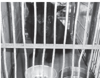
捕獲された犬（役場敷地内）