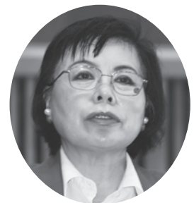
浅野 栄子 議員