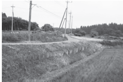
上吉原集落センター先の通学路