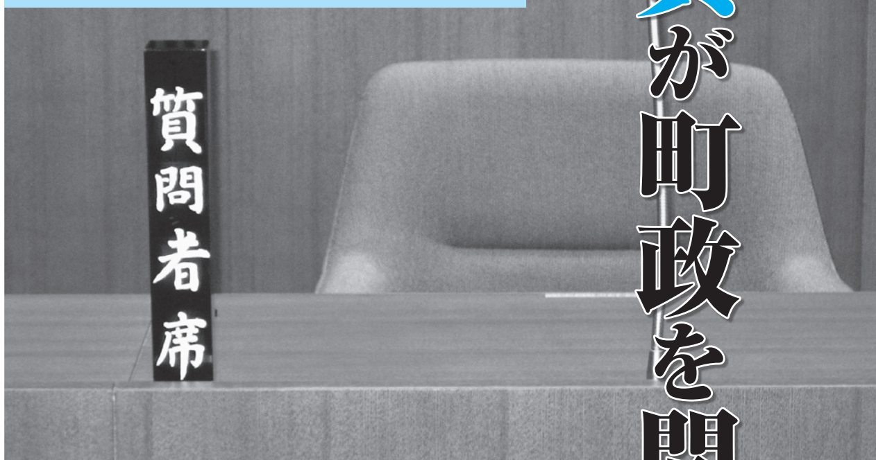
質問者席（阿見町議会議場）

一般質問は、公の場である議会で、議員が議案に関係なく、町長の考え方や町政の執行状況について事実の説明を求めたり、一問一答で所見を問いたすものです。