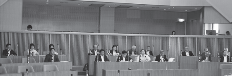
平成24年第2回定例会審議状況（6月22日）

初日には町長から条例の制定・一部改正のほか平成24年度一般会計補正予算などを含む議案16件が提出され、付託案件については、後日、各常任委員会でも慎重審議を行いました。一般質問では、新入議員を含む12名の議員が登壇し、活発に町政を質しました。 最終日には、全ての議案を可決しました。