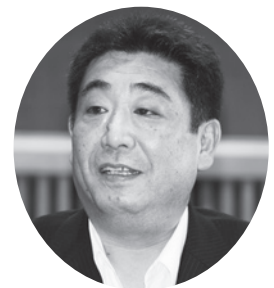
野口 雅弘 議員