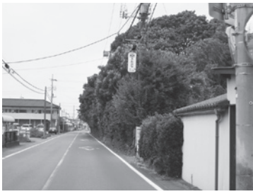
危険な通学路（中央）