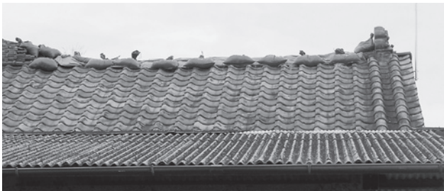
昨年の震災でいまだに壊れている屋根瓦

宅リフォーム助成制度については、今町でやることではないと、これはもう一貫して何度も言っているかと思えます。