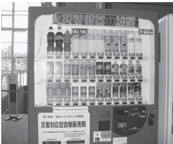
導入が待たれる災害対応型自動販売機(災害時には機内の飲料を無料提供、災害情報も電光掲示板に表示)

公共施設に28台設置する販売機を契約更新時に導入を図りたい。メールマガジンのメールサービスの仕組みを考え進めます。