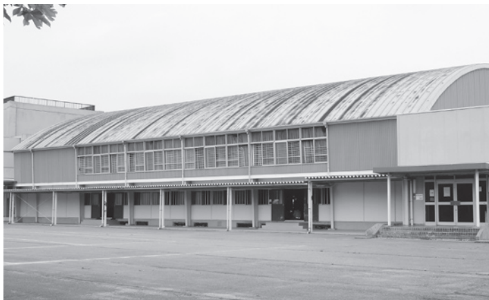
耐震補強工事が行われる朝日中学校校舎及び体育館