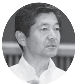
海野 隆 議員