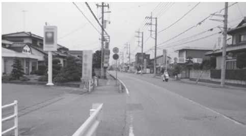
阿見第二小入口信号（西郷）