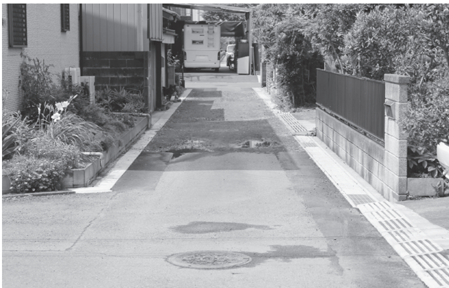
部分的に舗装されていない生活道路（中央）

安全で快適な住環境及び高齢者の安全確保を図るためには、最低限4メートル道路幅員を確保することこそ安心で安全な道路につながる。