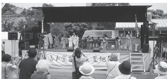
阿見（君島）から港区のまつりへ民間交流