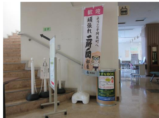
本郷ふれあいセンター