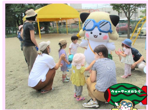
あみっぺが遊びにきたよ ♪