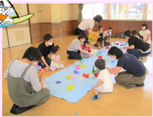
🐟 釣り楽しかったね ♪