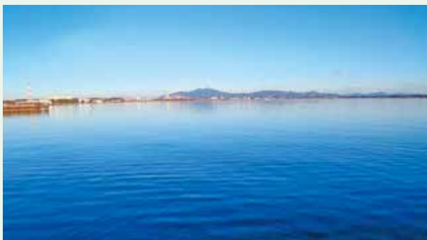
霞ヶ浦・筑波山を望む自然豊かな立地。水のレジャーも山のレジャーも「すぐそこ」で楽しめます！