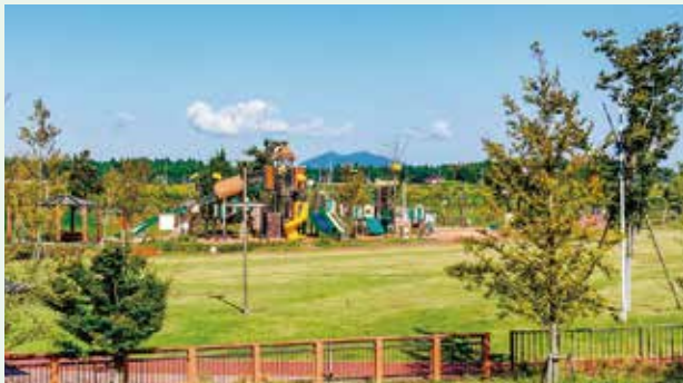
子どもたちの笑顔のあふれる公園が町内にたくさん整備されています！