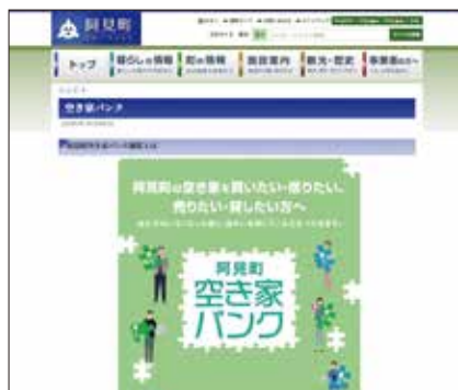
空き家バンクホームページ