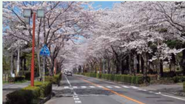
茨城大学農学部や私立中高など町内に揃う充実した教育環境！