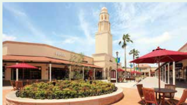
人気の「あみプレミアム・アウトレット」もある阿見町ならショッピングも楽しめます！