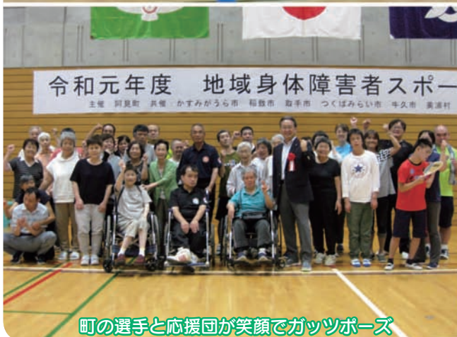
町の選手と応援団が笑顔でガッツポーズ