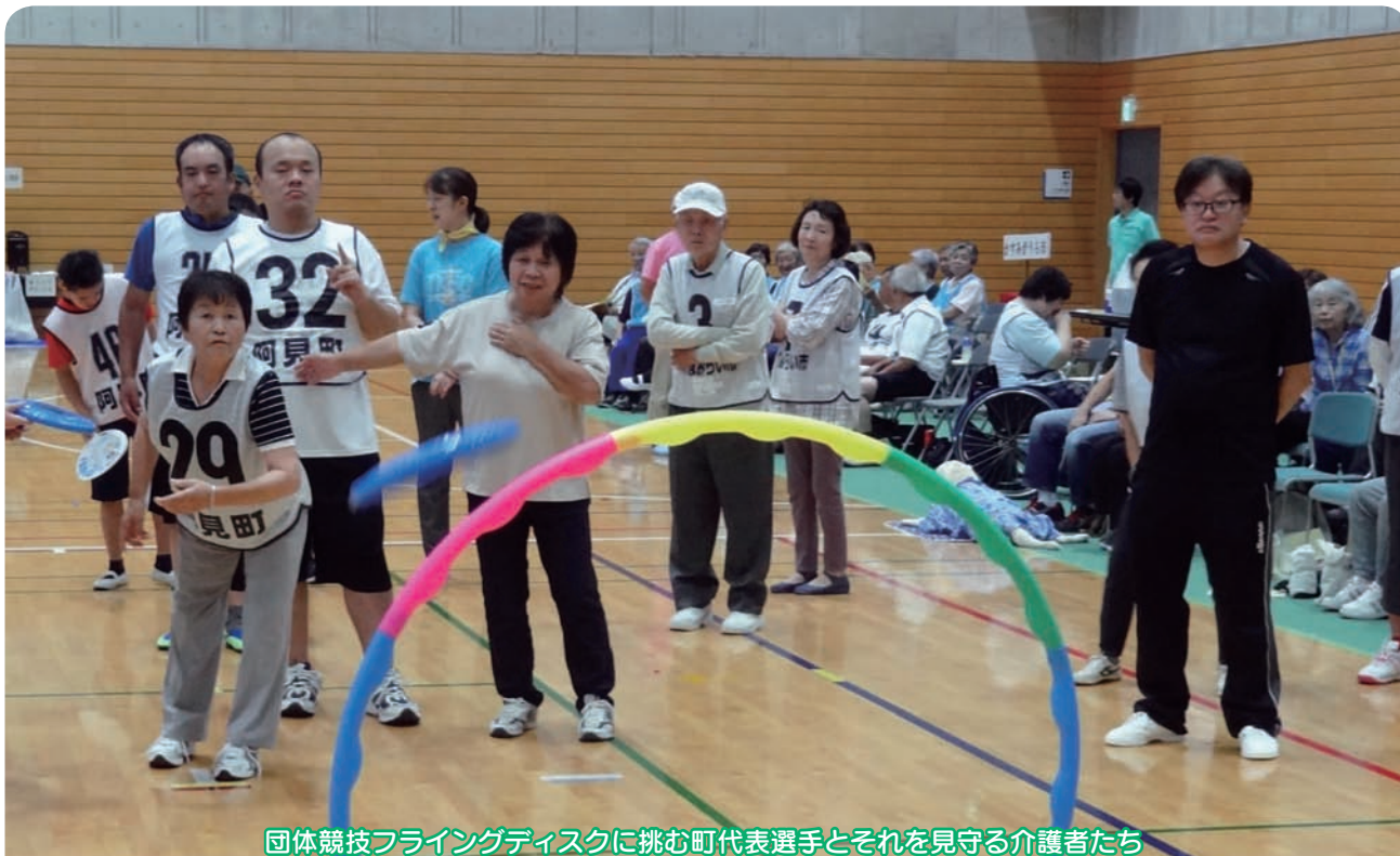
団体競技フライングディスクに挑む町代表選手とそれを見守る介護者たち