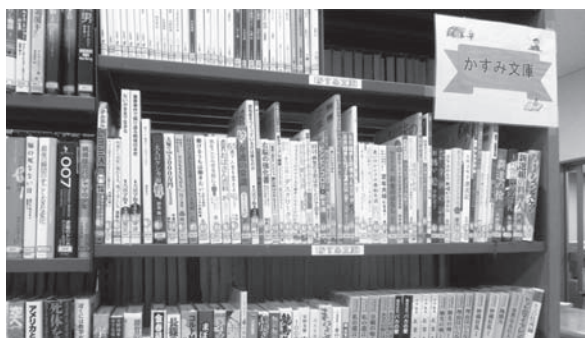
▲かすみ公民館図書室内にあります

『かすみ文庫』を設置しました 毎年購入される本の冊数には限りがあり、利用者のニーズに応えられない傾向にありました。そのため、利用者の貸出冊数が減少傾向でしたので、利用者の本に対する興味関心を高め、貸出冊数も増やしていきけるように「文庫」コーナーを設置しました。設置後9か月が経過し、少しずつではありますが貸出冊数に伸びが見られました。 現在の図書文庫コーナー資料は、文学関係(大活字本も含む)や高齢者向けの本が中心で蔵書数は100冊程ですが、これからも図書環境の充実を努めていきたいと思っております。