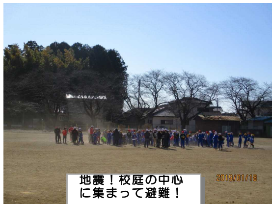
地震！校庭の中心に集まって避難！