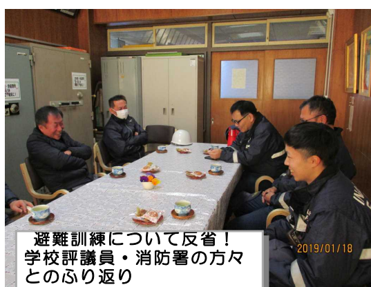
避難訓練について反省！ 学校評議員・消防署の方々とのふり返し

1月18日（金）に予告無しの『避難訓練』を実施しました。休み時間をそれぞれの場所で楽しく過ごしていたところに非常ベルが鳴り響きました。子供たちは、「地震発生！避難してください」を合図に、校庭・教室・廊下・図書室等から「どう避難するか」を一人一人考えながら、避難をすることができました。『自分の身は自分で守る』と常日頃から話し合っていますが、落ち着いた態度で、真剣な態度で避難する様子から、消防署の方々からお褒めの言葉をいただきました。その後、校長室で、学校評議員・消防署の方々と避難訓練のふり返しを行い、今後の防災について、ご意見等をいただきました。