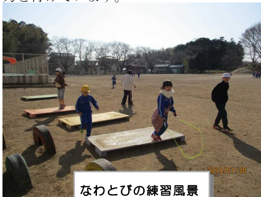
なわとびの練習風景

そんな中、子供たちは、元気に縄跳びの練習など、元気に生活しています。風邪に負けない体力を付けています。