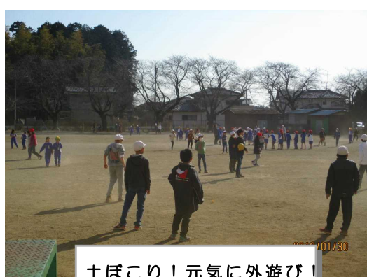
土ぼこり！元気に外遊び！