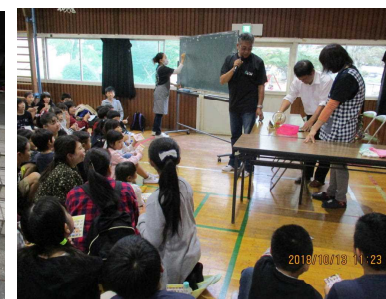
大興奮！ピンゴ大会！！