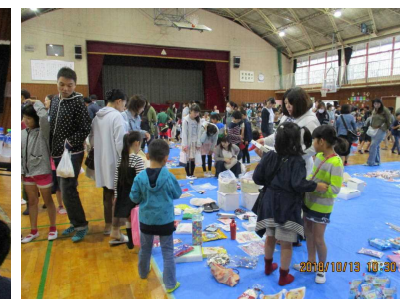
提供品販売コーナー