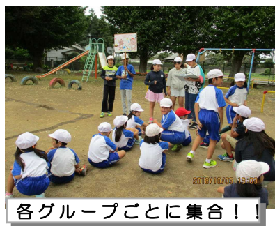
各グループごとに集合！！

1年生から6年生がいっしょになって活動する【なかよし学級】。6年生が中心となって、楽しく活動しています。