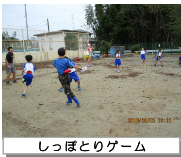
しっぽとりゲーム