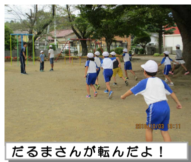
だるまさんが転んだよ！