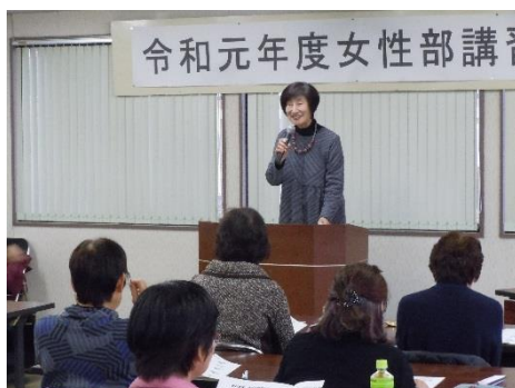
11/22(木)出前講座(商工会)