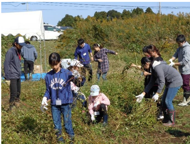
▲そばの実の収穫です！

茨城大学農学部の学生が行う地域参画プロジェクト。地域連携と共に食農教育を実施しています。