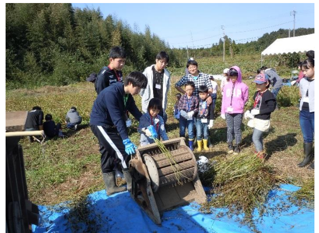
▲千歯こき：くし状の歯に引っ掛けてそばの実を取ります