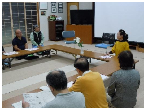
10/17(木)出前講座(しらゆり会)