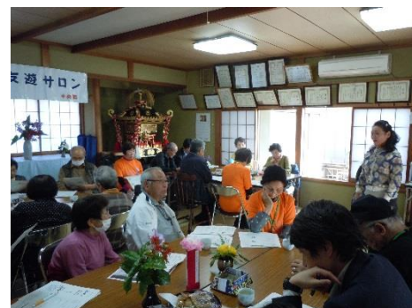
11/25(月)出前講座(友遊会)