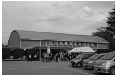
実穀小学校体育館

学校施設整備事業では、実穀小と吉原小と君原小の屋内運動場の非構造部材の改修工事の実設計業務があり、これについては入札等により差金