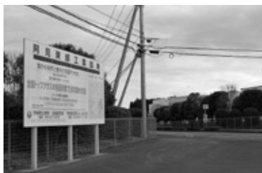
企業誘致が進む東部工業団地