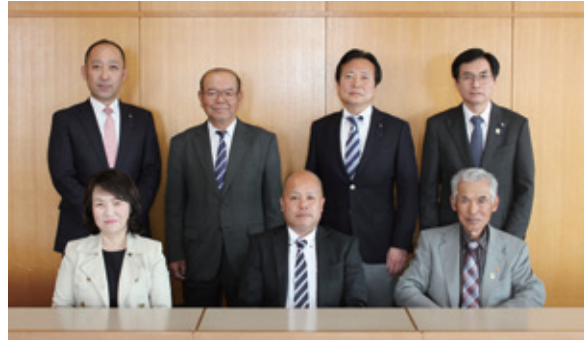
議会だより編集委員会 (4月19日)