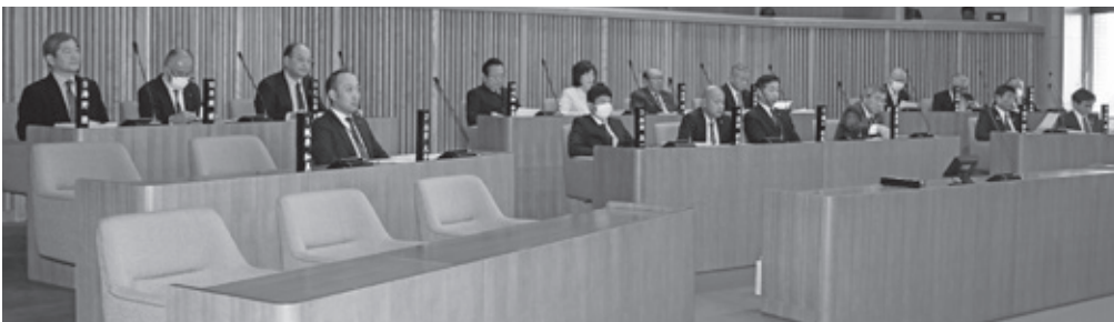
平成30年第1回定例会の様子（3月16日）

また、提出された平成30年度当初予算に対しては、予算特別委員会が設置され、後日慎重審議を行いました。2日目は一般質問を行い、4名の議員が登壇し、活発に町政を質しました。最終日には、平成30年度当初予算を含むすべての議案が可決されました。