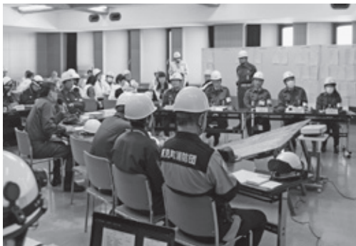
災害対策本部（訓練時）

「災害対策本部設置・運営訓練」を継続的に、災害対策本部の練度向上を図りたいと考えます。