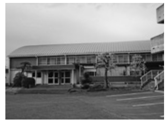
吉原小学校体育館

答 利用登録団体に登録して頂く事により、引き続き4月1日以降も「みなし規定」で切れ目なく利用頂けます。