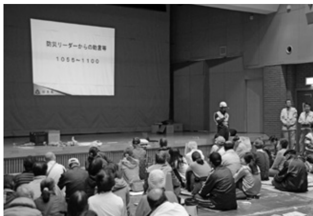
立ノ越・新町・廻戸地区合同防災訓練の様子

答 講師謝礼は、防災訓練等を行う場合の謝礼として計上していましたが、今年度は立ノ越・新町・廻戸地区合同防災訓練を行い、講師として町の防災リーダーの方々等に与していただいたため、発生しませんでした。