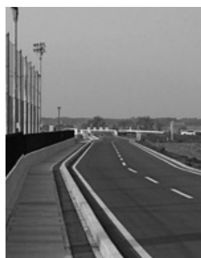
霞ヶ浦高等学校・附属中学校大室グラウンド東側拡幅道路

答 阿見坂下のところは、現在「りんロード」で整備・舗装をされて、自転車を通れるような状況になっています。