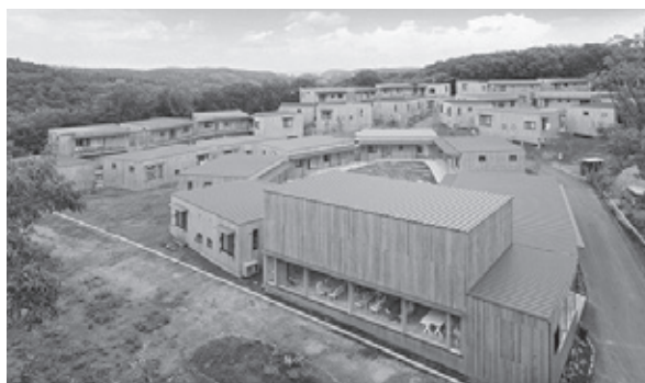
サービス付き高齢者住宅「ゆいま〜る那須」