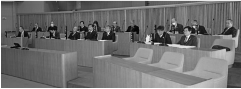
平成30年第1回臨時会の様子（1月19日）

平成30年第1回臨時会が、1月19日に開かれました。町長から条例の一部改正についての議案4件、補正予算についての議案6件が提出され、全議案が可決されました。