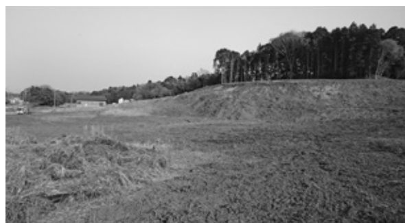
伐開工事をを行った追原町有地