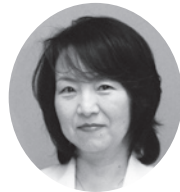
9. 紙井 和美 議員(P15)