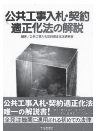
公共工事適正化法

教育次長 行政が導入する場合、公の財産を築くため設計や契約事項について精査を重ねている。また、補助事業のため国交省の基準がある。一般管理費があるところが異なる。今回の価格は決して高くはない。