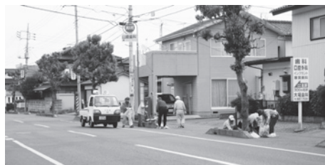
道路の美化活動に励む皆さん