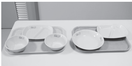
学校用食器類 (イメージ写真)

▼約30年前も同様に、 クリーム色の食器を 使った町の給食を食べ ていたが、もし絵柄の ある食器があれば給食 の時間はもっと楽し かったと思う。また、 多くの子ども達、保護 者の方に話を聞いたが、 ほぼ全員が絵柄の入っ たものの方が楽しいと いう意見であり、楽し く食事をするというの は、食育の一環である と思います、賛成します。