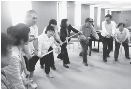
手をつなぐ育成会音楽療法の様子