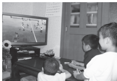
子どもはゲームが大好き