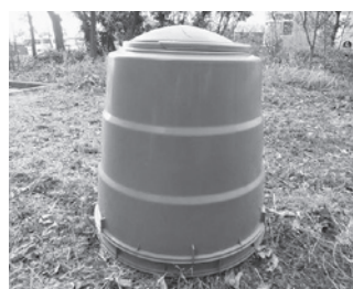
生ごみ処理機(コンポスト)

ライ方式というのがあり、これで処理をする。これでもほとんど無臭、時間も約6時間でサラサラの堆肥になる。他県の業者は生ごみで飼料7割・肥料3割を創り販売をしている。コストも安くできる。ぜひ、新しい給食センターの生ごみを再生利用していただきたい。