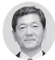
10. 海野 隆 議員(P16)