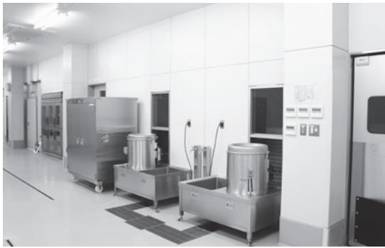
新学校給食センター (内部)

答 生徒児童が毎日使用する食器であるため、町に愛着を持ち、郷土愛を育てる意味でも入れた方がよいと判断しました。印字の無い場合の見積もりは、約二割(約350万円)の差がございます。