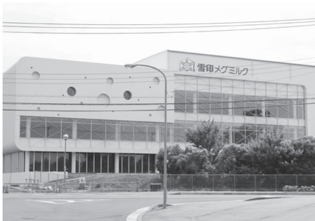
東部工業団地内に建設中の雪印メグミルク

たために、工場立地法による緑地面積を緩和して、企業誘致を推進することになりました。また、特に問題となつたことは、ありません。