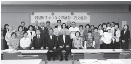
手をつなぐ育成会設立総会

し、今年度からは新 たに日中一次支援事 業（障がい児預かり 事業）を委託します。 ⑤就労機会では町内施 設の清掃業務を委託。 施設側からもよい機 会が得られたとの声 が寄せられています。 ⑥生活環境の改善では、 外出時の介助等、移