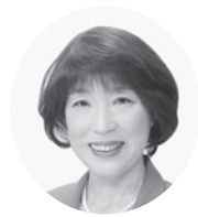
7. 難波千香子 議員(P13)