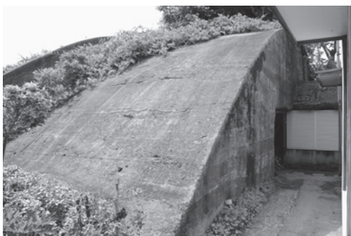
町内にある掩体壕（上郷地内）