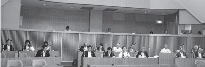
平成25年第2回定例会審議状況（6月21日）

初日には町長から条例の制定・一部改正のほか平成25年度一般会計補正予算などを含む議案21件が提出され、付託案件については、後日、各常任委員会で開催、各常任委員会では、慎重審議を行いました。一般質問では、12名の議員が登壇し、活発に町政を質しました。 最終日には、全ての議案を可決され、請願は不採択となりました。