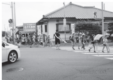
ゾーン30の指定が待たれる危険な通学路（阿見小付近）

参考となるものであり、関連する情報収集に努め、協働による地域の安全向上に努めていきます。