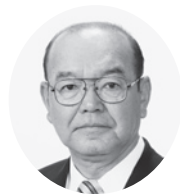
8. 柴原 成一 議員(P14)