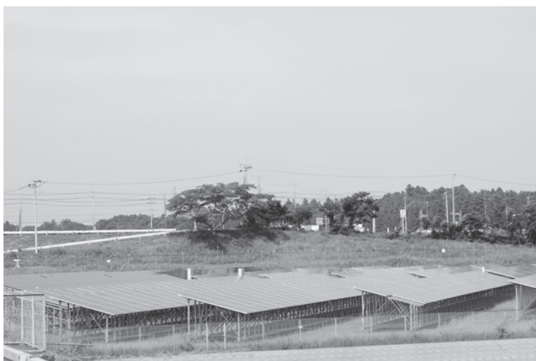
香澄の里工業団地内調整池に設置された太陽光発電システム

えています。今年度、37・8円の買い取り価格が決まり、この価格で事業計画が成り立つか基本計画として検討するものです。内容としては、50KW未満、低圧のものを各学校に設置できないかということです。