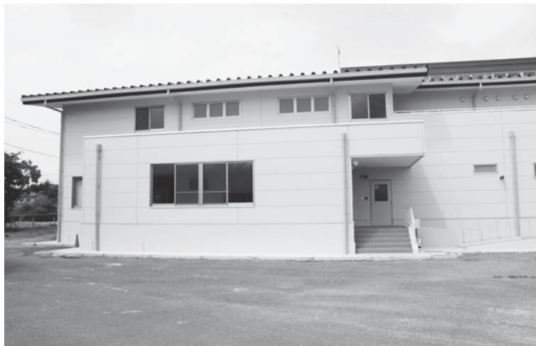
新学校給食センター外観

請願第3号 阿見の子ども達を放射能被曝から守るための調査ならびに対策に関する請願書は、委員会では賛成多数により、採択しました。