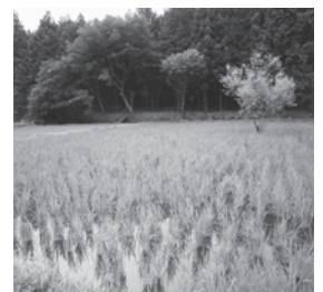
よみがえる耕作放棄地

天田町長／農業者等の組織する団体等がまとまった耕作放棄地を活用する取り組みについても支援を行っております