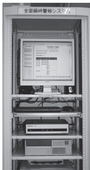
役場庁舎内に設置されているJアラート（2階）

答 地域防災組織育成事業で、共通しているのが、AEDセットの整備になり、その他は住吉区が移動かまど、エンジンカッター、油圧ジャッキ。レイクサイドがボール、のこぎり、ハンマー、発電機。筑見がAEDだけの整備です。また、全国瞬時警報システムは、国の交付金10分の10の事業です。当町は、既にジェイアラートが設置され、国からの情報を自動的にジェイアラートから瞬時情報を配信するシステムです。